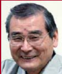
Sensei Yoshida Partenaire de LEAN TRAINING®

J'apprends encore beaucoup de Henri Ford, par Sensei Yoshida.